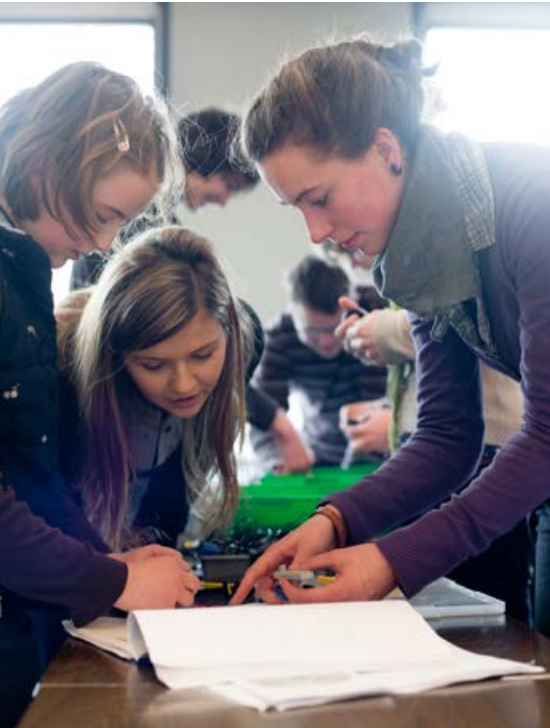
Bei Jugendlichen die Eigenverantwortung fördern und älteren Menschen die aktive Teilhabe am gemeinschaftlichen Leben ermöglichen

Die Friedrich Schiedel-Stiftung ist Mitglied im Bundesverband Deutscher Stiftungen und im Stiferverband für die Deutsche Wissenschaft.