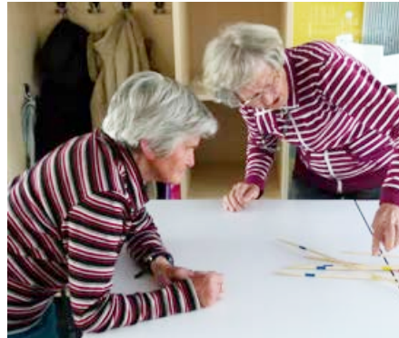
Wissenschaft in ihrem Dialog mit der Gesellschaft unterstützen